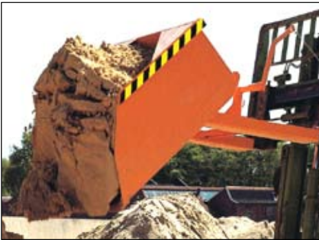
Typ BSE in Kippstellung